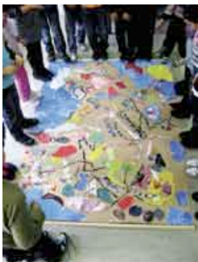
Iedereen tevreden? Hier en daar moet nog wat worden opgeplakt

Ook waterwegen, zeeën en rivieren werden apart gemaakt; met lekker veel blauw in alle tinten. En er waren groepjes voor de landschappen en voor de grenzen. Dat laatste was een grappige en speciale taak. Zijn er ook rechte grenzen of is het altijd zo'n vrolijk kronkellijn? Zijn er altijd grenzen? In de laatste les ontstonden ook de verhalen bij de elf landen. Hieronder die bij 'Het verloren land' van groep 4/5 van juf Fari op de Linnaeussschool.