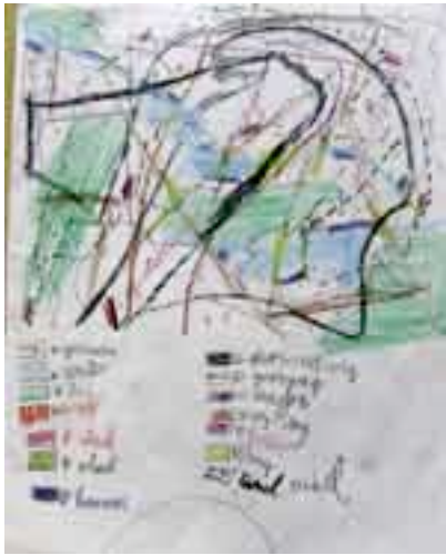
De route van huis naar school, getekend in de eerste les

Dertien groepen van de Lidwinaschool, Aldoende, De Linnaeussschool, De Coligny en De Kaap deden mee in het afgelopen half jaar. In de eerste lessen zochten de kinderen uit hoe het zit met de straten, gebouwen, pleinen en waterwegen die ze kennen uit hun eigen buurt. Hoe ziet de route van huis naar school er van bovenaf uit? Wat komt er wel en wat komt er niet op zo'n plattegrond? In deze lessen werden prachtige kleine kaartjes getekend. Steeds probeerden de kinderen te bedenken hoe alles er vanuit de lucht uit zou zien. Kijk bijvoorbeeld eens naar de prachtige serie van bovenaf bekeken trappen. Met inventieve oplossingen voor een soms moeilijk probleem.