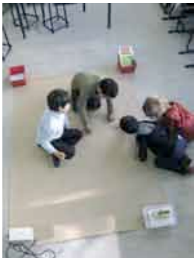
Het groepje van 'de grenzen' aan het werk

Welke kleur en vorm hebben wegen, gebouwen, parken of water in een atlas? Een atlas? Zo'n boek met kaarten, dat is eigenlijk een soort veelkleurige schatkamer. Net zoals sommige