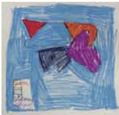
Minilandkaart uit het begin van het project

Dertien groepen van de Lidwinaschool, Aldoende, De Linnaeussschool, De Coligny en De Kaap deden mee in het afgelopen half jaar. In de eerste lessen zochten de kinderen uit hoe het zit met de straten, gebouwen, pleinen en waterwegen die ze kennen uit hun eigen buurt. Hoe ziet de route van huis naar school er van bovenaf uit? Wat komt er wel en wat komt er niet op zo'n plattegrond? In deze lessen werden prachtige kleine kaartjes getekend. Steeds probeerden de kinderen te bedenken hoe alles er vanuit de lucht uit zou zien. Kijk bijvoorbeeld eens naar de prachtige serie van bovenaf bekeken trappen. Met inventieve oplossingen voor een soms moeilijk probleem.