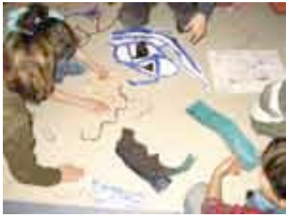
Groep 5b aan het werk aan Supervijfland op de Lidwinaschool

Hoe ziet de wereld er van bovenaf uit? Met beeldend kunstenaar en verteller Maarten Sprenger maakten kinderen van vijf basisscholen uit Oost-Watergraafsmeer in vier weken een wandvullende landkaart.